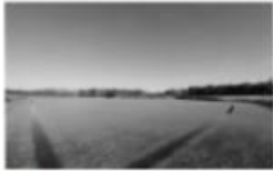
La coltivazione in pieno di un campo di risaie per individuare misure che possano salvaguardare un settore che vede l'Italia leader in Europa.