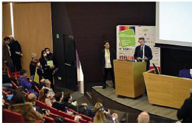
Al Mann Un momento dei lavori del Salone della responsabilità sociale e condivisa

Al primo cittadino è stato presentato il progetto esecutivo per la realizzazione nel 2022 degli Stati generali del Mediterraneo che a ottobre del prossimo anno saranno la punta di diamante della decima edizione del Salone, con attività divulgative e di networking affidate a testimonial d'eccezione. «Parlare di sostenibilità e responsabilità sociale su scala mediterranea è di enorme importanza per Napoli, che ha bisogno di un modello innovativo di sviluppo e di crescita. Affrontare temi quali inclusione e riduzione dei divari in dimensione transnazionale è un tema di enorme importanza», ha commentato Manfredi. Con una trenti-