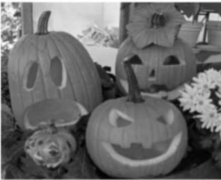
quasi assenti con lo 0,1%. Come gli altri ortaggi, ridotti e frutti attaccati a pezzi di carotoni e pro-vitamina A. Tra